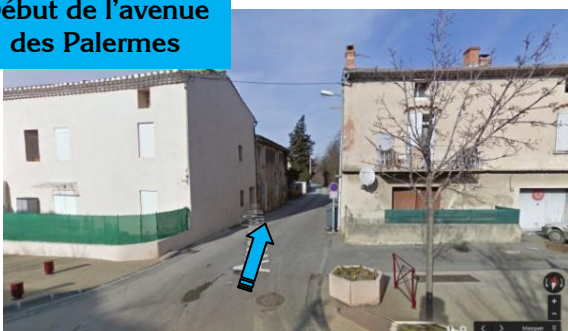
Début de l'avenue des Palermes