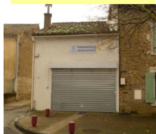
Local permanence Mairie en face de l'av. des Palermes